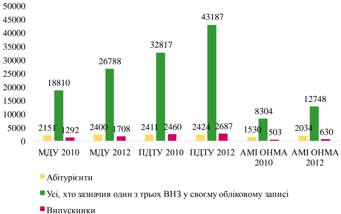
Рис. 1 Наявність випускників, діючих та потенційних студентів ВНЗ м. Маріуполь, зареєстрованих у соціальній мережі «ВКонтакте».

дослідження становлять три найбільші вищі навчальні заклади м. Маріуполь: Приазовський державний технічний університет (ПДТУ), Маріупольський державний університет (МДУ) та Азовський морський інститут Одеської національної морської академії (АМІ ОНМА).