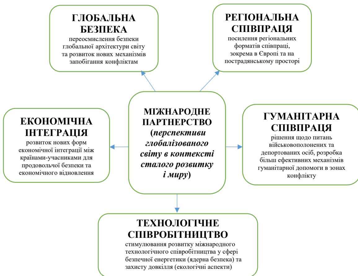
Рисунок 2. Перспективи партнерства глобалізованого світу на засадах сталого розвитку і миру (міжнародний аспект)

На рис. 2 нами у загальному вигляді систематизовано основні перспективні елементи глобалізованого світу, яких можна бути досягти за рахунок ефективного міжнародного партнерства, на засадах миру й сталого розвитку.