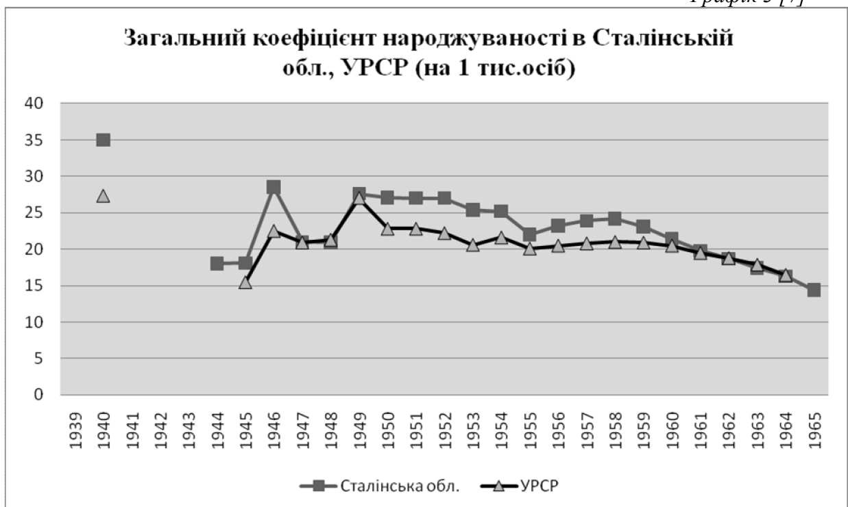
Графік 3 [7]

З графіка 3 видно, що потужне підвищення рівня народжуваності, котре спостерігалось у 1946 р., виявилось короточасним. Вже наступного 1947 р. загальний коефіцієнт народжуваності знизився по УРСР на 7,1%, по Сталінській області на 25,3%. Можна зробити попередній висновок про те, що на Донеччині вплив Голодомору на народжуваність був сильнішим, ніж по Україні загалом. У 1949 р. стався широко розрекламований у періодичній пресі сплеск народжуваності. Отже, внаслідок Голодомору 1946–1947 рр. компенсаційна хвиля повоєнних народжень була перервана і набула вигляду двогорбої. Вершинами компенсаційних народжень були 1946, 1949 рр. Жодного року показники народжуваності не перевищили довоєнну відмітку. На відміну від західних країн, ні населення регіону, ні України загалом «бебі буму» не зазнало.