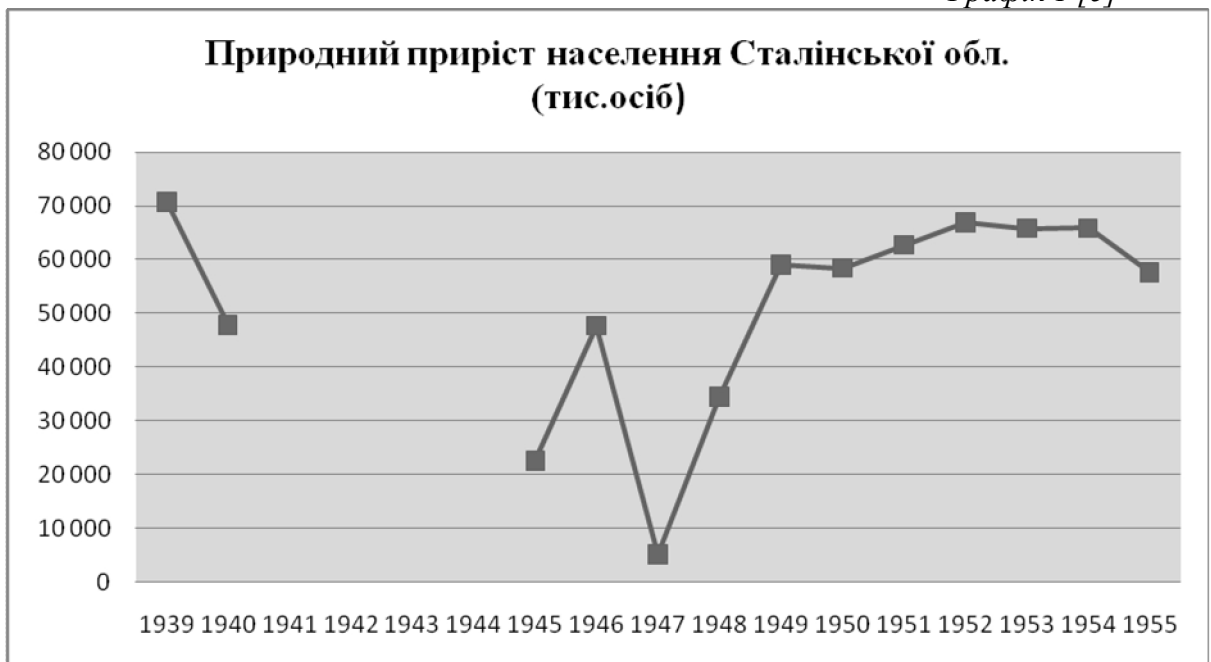
Графік 1 [5]

Для того, аби виявити регіональні відмінності демографічних процесів на територіях, чисельність населення яких є нерівнозначною, в демографії прийнято вираховувати показники на кожну тисячу населення (проміле) [3]. Проаналізувати загальний коефіцієнт природного приросту можна за допомогою Графіку 2.